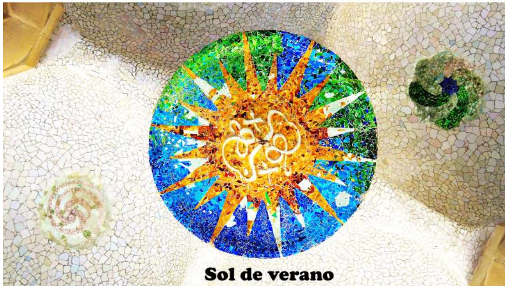
Sol de verano

Los cuatro soles siguen el mismo patrón: una estrella de 20 puntas con bordes finamente definidos, que encierra una larga cinta que forma dos bucles simétricos. Color: verde o azul para los fondos, y naranja o blanco, según la estación representada.