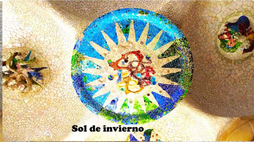
Sol de invierno