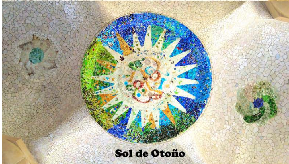
Sol de Otoño